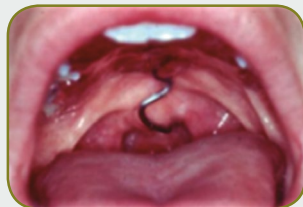
Fissura operada - insuficiência velofaríngea - obturador faríngeo