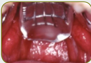
Fissura palatina não operada - obturador palatofaríngeo