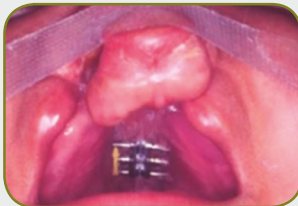
Fissura labiopalatina bilateral - placa palatina ativa