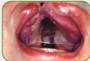
Fissura labiopalatina unilateral - placa palatina passiva

As malformações congênitas podem ocorrer como únicas ou múltiplas. Quando o paciente apresenta múltiplas malformações estruturais dizemos que ele é portador de uma síndrome. A fissura labiopalatina é uma das malformações congênitas mais frequentes, com incidência estimada no Brasil de um fissurado para 650 recém-nascidos. Em geral se manifesta como malformação única, mas não raramente faz parte de um quadro sindrômico. Apresentam alterações estéticas, funcionais e psíquicas e necessitam de tratamento oportuno e multidisciplinar.